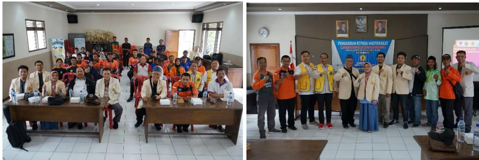
Gambar 4. Pelaksanaan kegiatan

teknis. Tahap ketiga adalah sosialisasi kegiatan kepada anggota komunitas (relawan). Informasi penyuluhan disebarakan melalui FPRB dan perangkat desa. Strategi ini dipilih karena dinilai paling efektif menjangkau para relawan. Tahap keempat merupakan pelaksanaan kegiatan penyuluhan di Balai Desa Claket. Kegiatan dimulai dengan sesi pembukaan, pengenalan tim, dan penyampaian tujuan program ( Gambar 4 ).