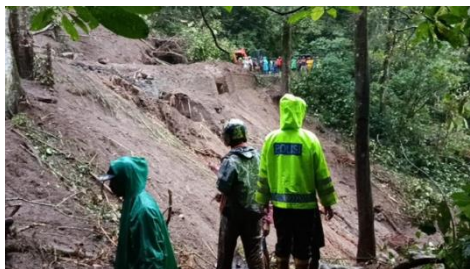
Gambar 1. Bencana tanah longsor di Pacet

Kecamatan Pacet Kabupaten Mojokerto merupakan salah satu wilayah yang memiliki tingkat kerawanan longsor cukup tinggi karena berada di kawasan pegunungan dengan topografi curam dan curah hujan yang relatif tinggi. Jalur Pacet–Cangar yang melintasi lereng pegunungan memiliki fungsi strategis sebagai jalur wisata dan mobilitas masyarakat. Pada April 2025 terjadi longsor besar yang menyebabkan korban jiwa dan terganggunya akses transportasi utama ( Gambar 1 ). Kondisi tersebut menunjukkan bahwa risiko longsor di wilayah Pacet bukan hanya berupa potensi, tetapi telah menjadi ancaman nyata yang memengaruhi aktivitas sosial, ekonomi, dan infrastruktur masyarakat.