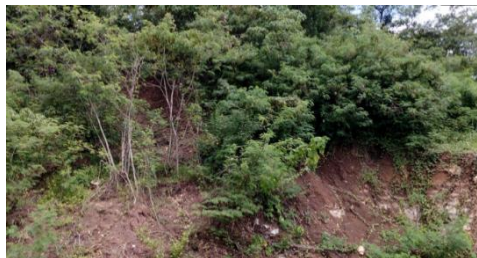
Gambar 5. Daerah Rawan Longsor

Berdasarkan hasil survei lapangan diketahui bahwa sebagian besar wilayah telah memiliki lingkungan lereng yang berfungsi baik. kemiringan lereng dan vegetasi cukup banyak dalam kondisi terawat, bersih, dan terbuka. Meskipun demikian, ditemukan beberapa titik yang berpotensi menimbulkan longsor saat curah hujan tinggi, terutama di daerah dengan elevasi lebih tinggi dan jauh dari pemukiman ( Gambar 5 ).