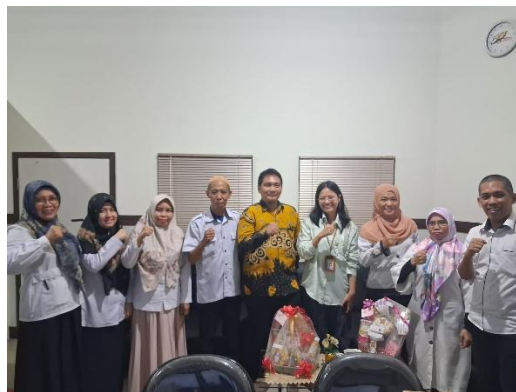
Gambar 3. Dokumentasi Pelaksanaan FGD bersama Dinas Koperindag Kab. Maros

Sebagian besar narasumber (N1, N3, N4, N6, N7, N8) menyoroti perlunya sosialisasi dan edukasi berkelanjutan kepada pelaku UMKM dan masyarakat agar mampu memahami informasi nilai gizi secara tepat. Sosialisasi ini dianggap penting untuk meningkatkan literasi gizi dan pemahaman terhadap manfaat label nutrisi digital. Narasumber juga menilai bahwa edukasi internal bagi aparatur dinas perlu dilakukan agar seluruh pihak memiliki pemahaman yang sama terhadap isi dan tujuan model FOPNLs.